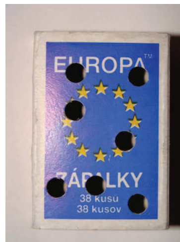
Obr.2: Dierkovačom perforovaná krabička zabezpečuje, aby vzorka neporástla plesňami. Pred predierkovaním vrchnáka vyberte vysúvaciu časť, aby ostala neporušená.

Ak je vzorka príliš vlhká, je možné ju nechať v otvorenej škatuľke čiastočne presušiť pri izbovej teplote počas 12-24 hodín. Vzorky nesušte na radiatore !!!! Pri balení vzoriek pred odoslaním používajte len priedušné materiály (papier, papierové krabice). Nevkladajte vzorky do igelitových vreciek a obalov , nakoľko takto zabalené vzorky plesnivujú a skresľujú výsledky získané z Vašich vzoriek !!! Vzorky balené do nepriedušných igelitových obalov nebudú vyšetrené.