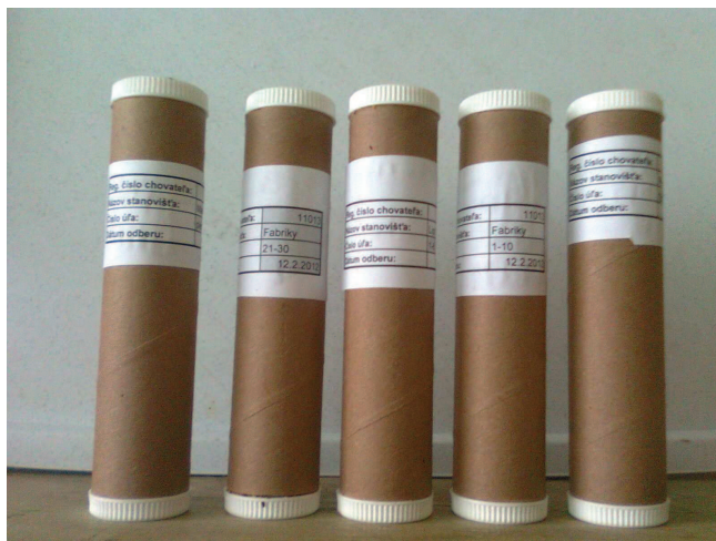
Obr 3: Správne označené vzorky.

Zmesné vzorky po odbere odovzdajú chovatelia na regionálnej veterinárnej a potravinovej správe. Táto zabezpečí vypísanie sprievodného dokladu a odošle vzorky do národného referenčného laboratória v Dolnom Kubíne.